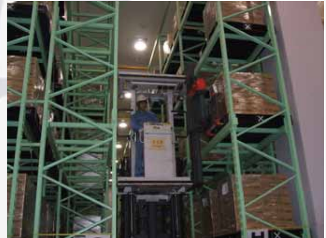
高層ラック倉庫とピッカーフォーク