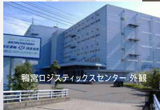
鴨宮ロジスティクスセンター 外観