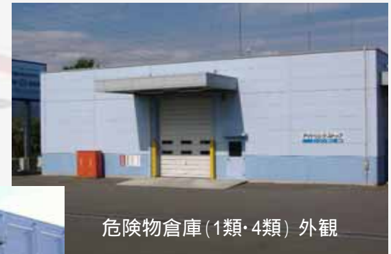
危険物倉庫(1類・4類) 外観